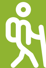
Calvaire du Rateau